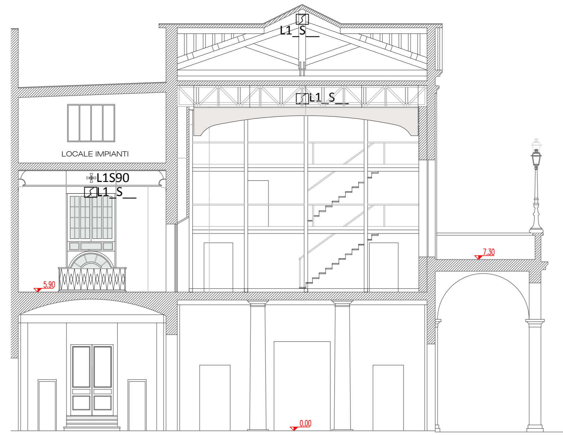
ATRIO TEATRO ARIOSTO