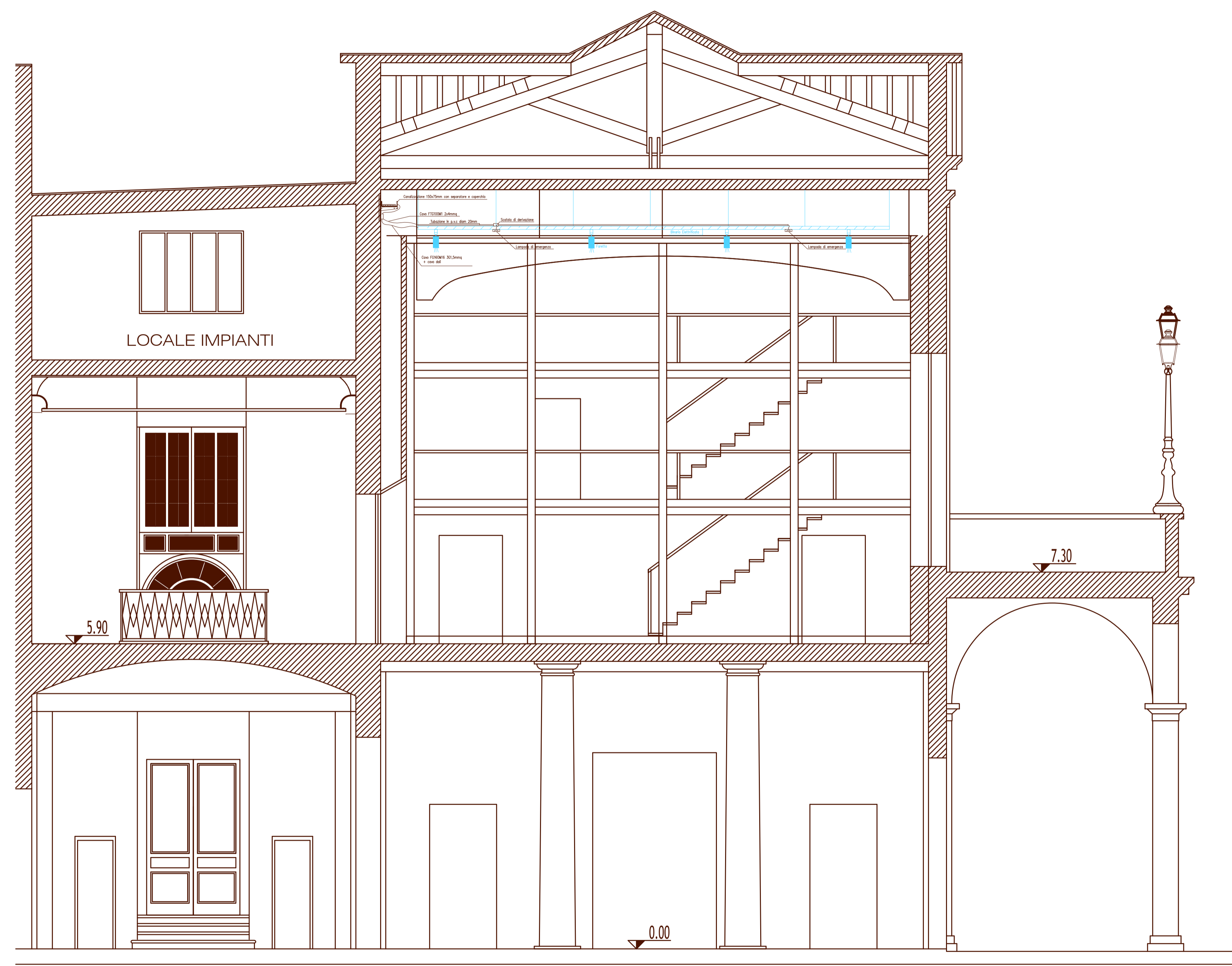
PARTICOLARE IMPIANTI LUCE QUOTA + 12,2m SALA VERDI SCALA 1:50