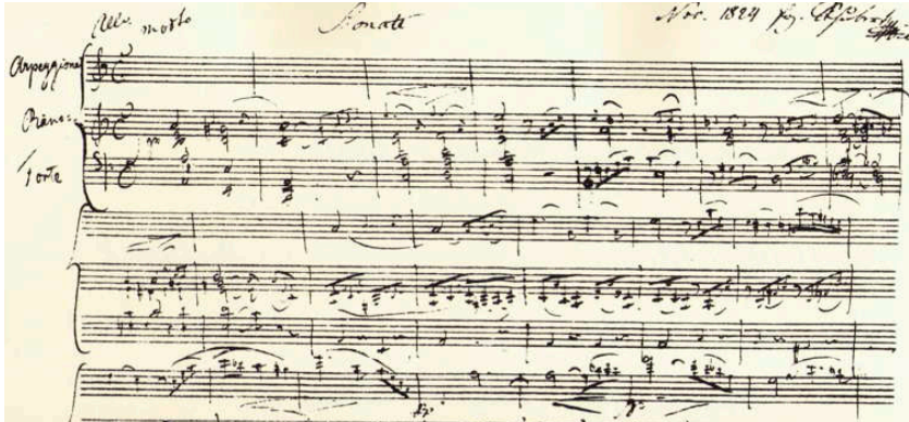
Partitura autografa della sonata "Arpeggione"